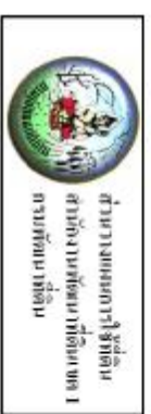
รูปที่ 3-3 แผนที่ภาพถ่ายทางอากาศ ตำบลทรายมูล อำเภออภัยราช จังหวัดนครราชสีมา